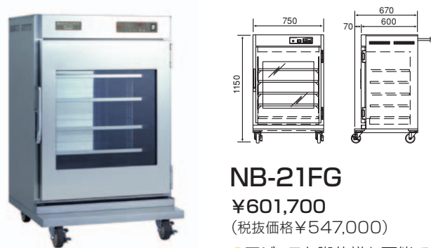
NB-21FG ¥601,700 (税抜価格¥547,000) ●アジャスト脚仕様も可能です。