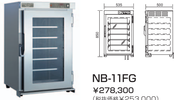
NB-11FG ¥278,300 (税抜価格¥253,000)