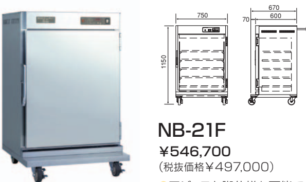
NB-21F ¥546,700 (税抜価格¥497,000) ●アジャスト脚仕様も可能です。