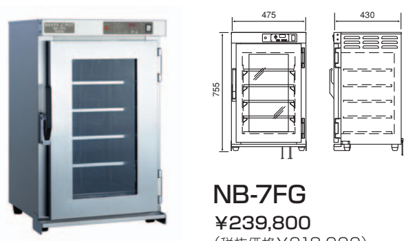
NB-7FG ¥239,800 (税抜価格¥218,000)