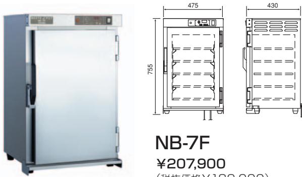
NB-7F ¥207,900 (税抜価格¥189,000)